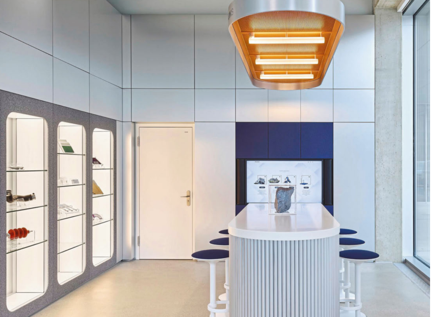
Der Showroom bietet Einblicke in die Innovationskraft des Unternehmens.