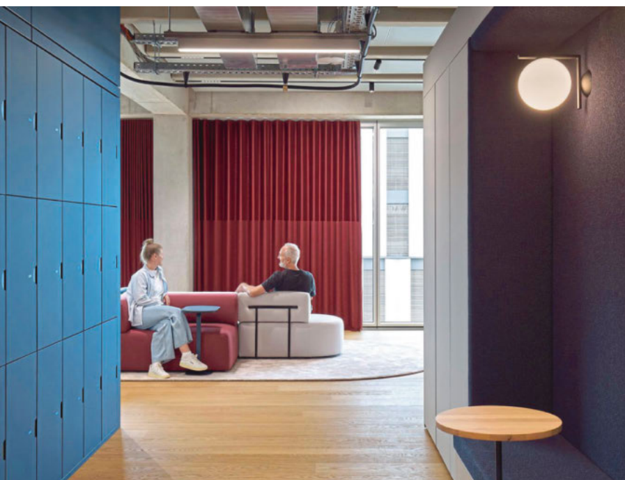
Verschiedene Worklounges sollen die Interaktion zwischen den Abteilungen fördern.