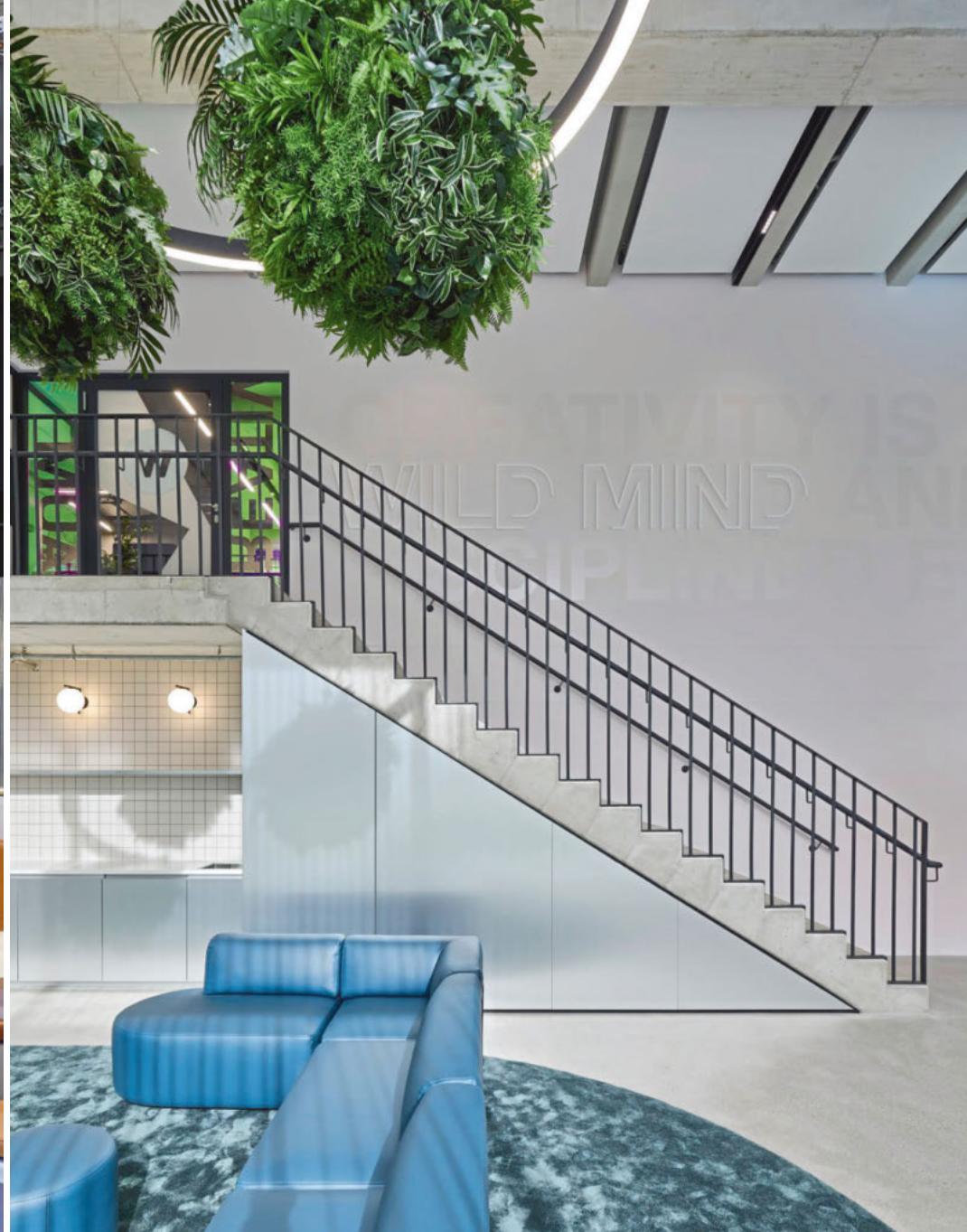
Links: Tubes strukturieren den Raum und verleihen ihm Tiefe. Mitte: Das Mitarbeiterrestaurant „Meet&Eat“ spielt mit Industrieanleihen. Rechts: Der Kreativraum unterstützt kollaborative Arbeitsformate wie Workshops und Brainstormings.

Der Umzug vom angestammten Firmensitz in der Satellitenstadt Neuperlach mitten hinein ins pulsierende Werksviertel am Münchner Ostbahnhof darf als klares Bekenntnis des Unternehmens zu einer neuen Arbeitskultur gelten. Damit wollte Wacker Chemie wegkommen von traditionellen Strukturen, hin zu flexiblen und agilen Arbeitsweisen, die den Austausch fördern und zu neuen Denkansätzen und Visionen motivieren. Nebenbei sollte der Ort viele Gründe dafür liefern, das bequeme Homeoffice zugunsten eines anregenden Umfelds zu verlassen. Das mit dem Ausbau beauftragte Büro Scope Architekten war früh in